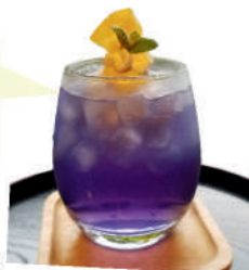
あじさいフロート 600円(税込)

アジサイカラーのソーダにマーブルアイスをのせた6月限定のフロートです。レモン果汁を入れることで変化するソーダの色をお楽しみください。