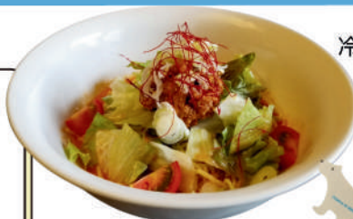
冷やし赤うま担々麺 950円(税込)