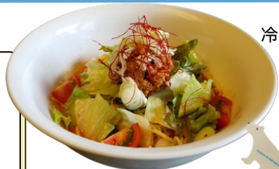
冷やし赤うま担々麺 950円(税込)