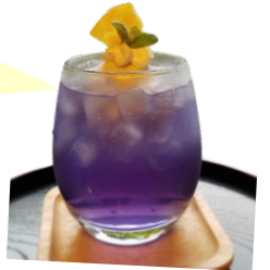
あじさいフロート 600円(税込)

アジサイカラーのソーダにマーブルアイスをのせた6月限定のフロートです。レモン果汁を入れることで変化するソーダの色をお楽しみください。