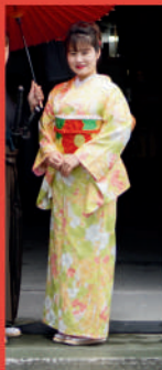
③Machimusume (Town Girl)