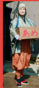
⑦Ame-uri (Candy vendor)