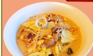
宗像の味噌ちゃんぽん 900円