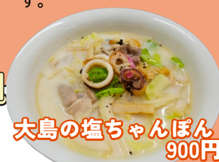
大島の塩ちゃんぽん 900円

当日の食事メニューは『大島の塩ちゃんぽん』と『宗像の味噌ちゃんぽん』、『勝屋酒造さんの酒粕入り炊き込みご飯』、『勝屋酒造さんの甘酒入りぜんざい』のみとさせていただきます。