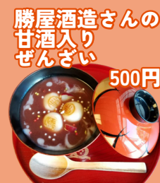
勝屋酒造さんの 甘酒入り ぜんざい 500円