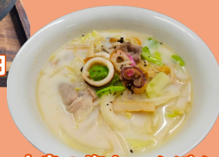
大島の塩ちゃんぽん 900円