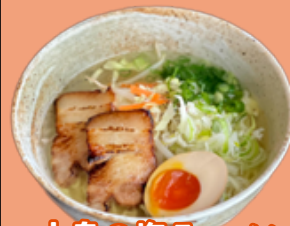
大島の塩ラーメン 850円