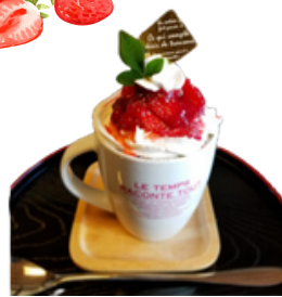
ストロベリーカップスフレ