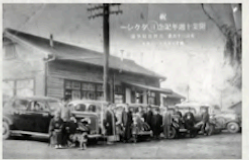
▲昔の赤間駅北口の様子

登山道の合流地点まで来たら、頂上まではあと少し！！「人生は登山から」の札や三角形に積まれた石も見つけてくださいね♪