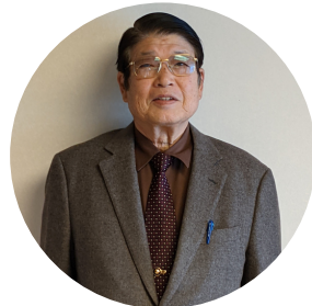
かなはしくにかつ