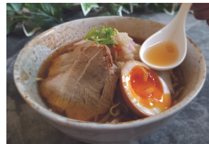
宗像醤油ラーメン850円