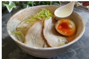
大島の塩ラーメン850円