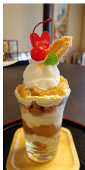
アップルパイパフェ 600円