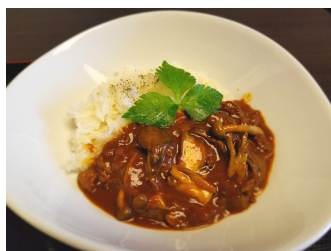
たっぶりキノコのハヤシライス 850円