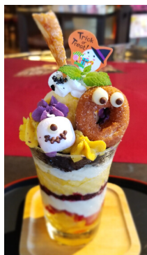
ハロウィンパフェ 600円