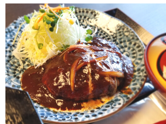
煮込みハンバーグ定食 850円