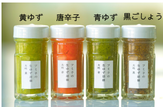
生ゆず胡椒はいずれも1,680円(税込)

左から、フミ子の生ゆず胡椒 大吟黄 フミ子の生ゆず胡椒 大吟赤 フミ子の生ゆず胡椒 大吟青 フミ子の生ゆず胡椒 大吟黒