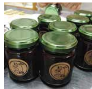
ブルーベリージャム 150g