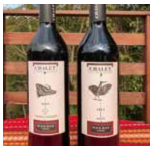
ブルガリアワイン シャレー カベルネ&メルロー 750ml