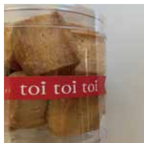
エダムとパルメザンと 唐辛子 100g