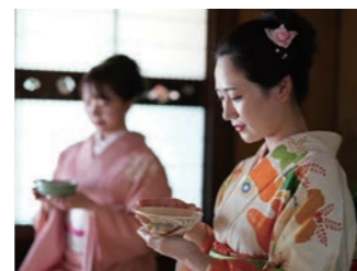
萩尾邸での抹茶体験