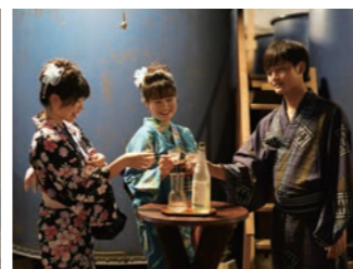
勝屋酒造にて利き酒体験