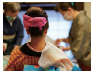
手ぶらでOK。簡単なヘアセットも