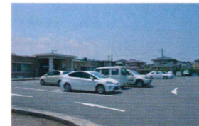
②赤間地区コミュニティ・センター