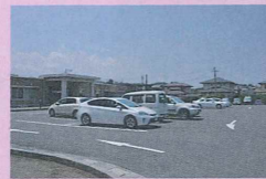
赤間地区コミュニティ・センター