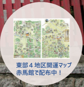
東部4地区開運マップ 赤馬館で配布中!