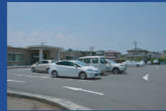
赤間地区コミュニティ・センター