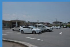
赤間地区コミュニティセンター