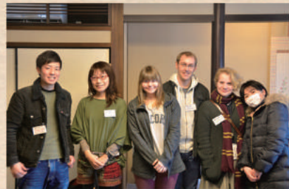
赤馬館にもお越しになり記念の集合写真を1枚！

2月22日に赤間宿街道で赤間宿まつりが開催されました。お祭りでは、五卿になって街道を歩く大名行列や2組のカップルをお迎えして、須賀神社で結婚式を挙げるなどのイベントも満載でした。