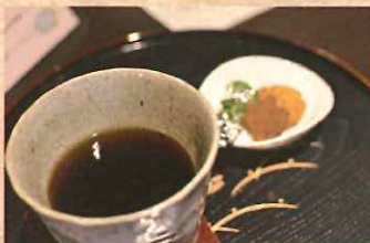
価格もお手頃！コーヒー ¥200