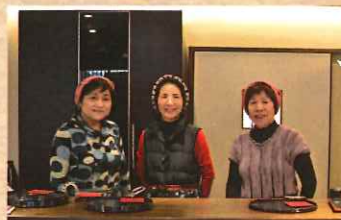
遊びにきてね〜！と気さくな店舗の皆さん